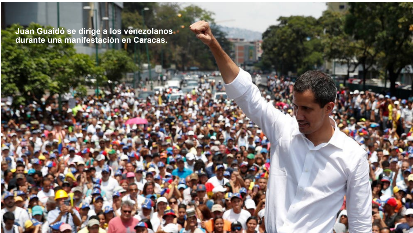
Juan Guaidó se dirige a los venezolanos durante una manifestación en Caracas.

“Yo creo que llegarán a vencer, pero eso tardará tiempo. La situación es difícil. Claro, son presos políticos. Hubo huelga de hambre. Yo estoy en constante contacto con ellos, he visitado Venezuela animándolos para que luchen y lo seguiré haciendo en el futuro”.